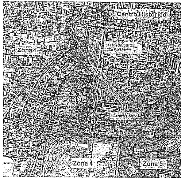
Imagen 5. Ejemplo de análisis espacial sobre ortofotografía